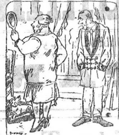
La moda del pelo corto. Ella.—A ti no te gurto así porque no eres hombre moderno; en cambio, yo, ves, el Papa es partidario de los cabellos cortos... El.—¡Porque no te ha visto! (De Le Ritré, de París.)

Vigo 11.—POR TELEFONO.—A bordo de un vapor han llegado todos los tripulantes del «Arlanda», que se fué a pique y a los que se creía ahogados en la catástrofe marítima. Los naufragos han llegado en condiciones lamentables, extenuados, medio desnudos y algunos heridos en su lucha con el oleaje que los arrastraba a las rocas.