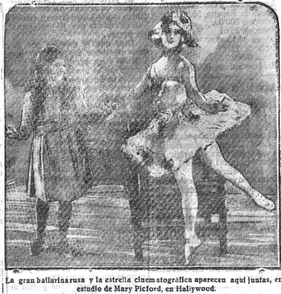
La gran ballarina rusa y la estrella cinematográfica aparecen aquí juntas, en estudio de Mary Picford, en Haliywood.