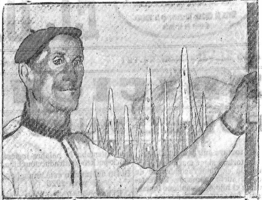
MADRID.—Cuadro del pintor Tellauche, a quien se ha ofrecido un banquete por el éxito de su Exposición, recientemente clausurada.

Suscríbase a EL DEFENSOR, dos pesetas al mes