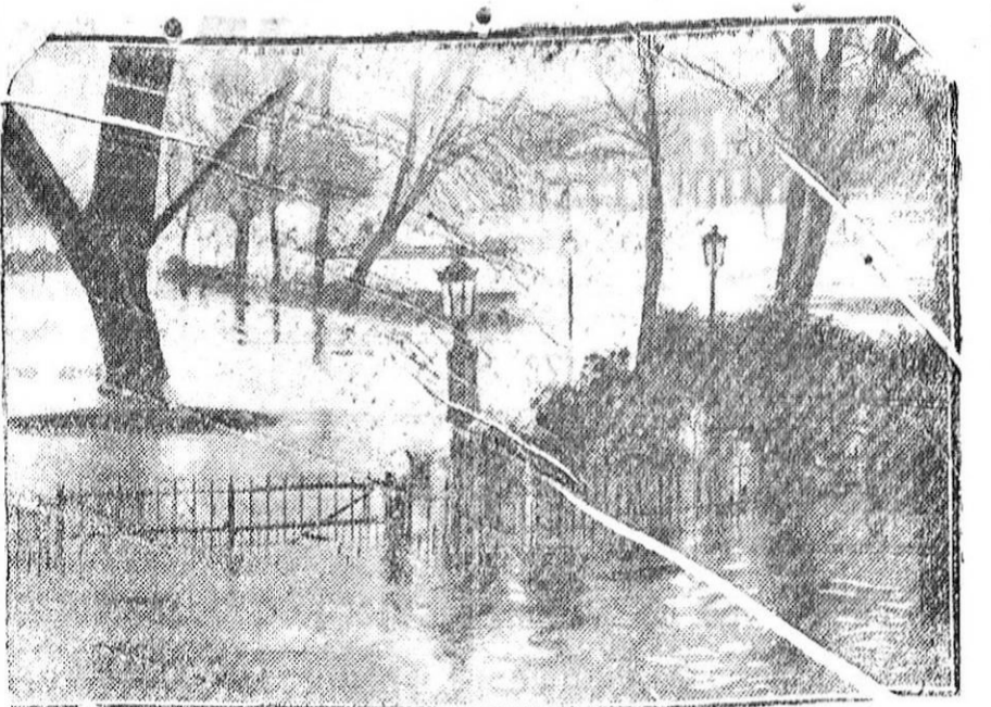
La crecida del Sena prosigue, según los últimos despachos y los alrededores de París se ven seriamente amenazados. Esta fotografía ofrece un aspecto de la llamada Isla de Vert Galan y da idea de las proporciones que la inundación ha alcanzado en la capital de Francia.

A virtud de un concurso fue nombrado secretario de aquella Corporación en 16 de Septiembre de 1916, en cuyo cargo continúa.