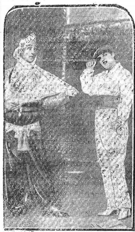
MADRID.—Una interesante escena de «Santón Pirulero», de los señores Vidal Moya y Alvarez, música del maestro Medavilla.