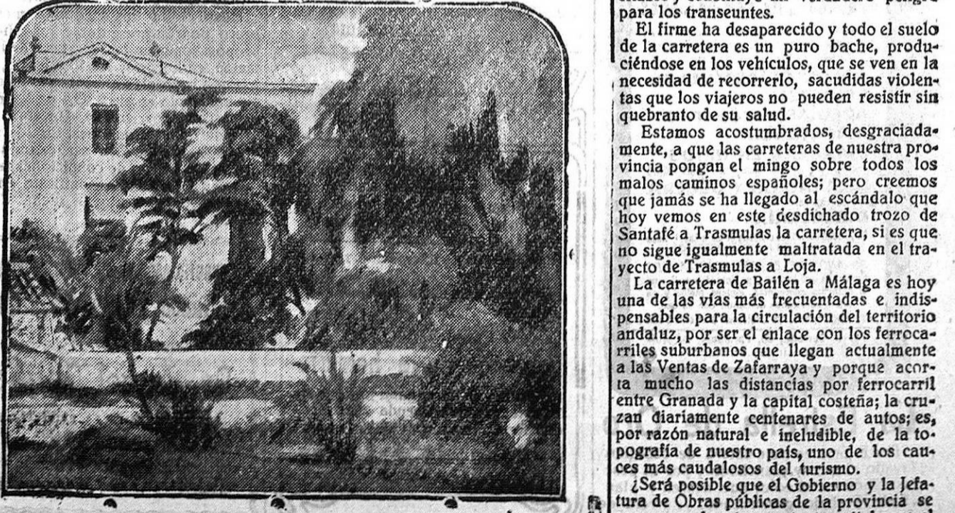
En la Exposición de Arte catalán del «Heraldo de Madrid» «MASSIA CATALANA», por Jacinto Olivé

El Defensor de Granada es el diario de mayor circulación de la provincia. Confecciona dos ediciones diarias.