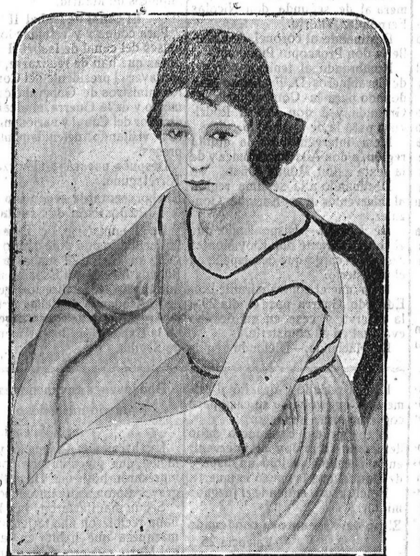
La Exposición de Arte Catalán organizada por «Heraldo de Madrid» «NIÑA SENTADA», por Manuel Humbert