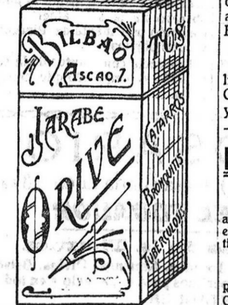
EL MEJOR remedio para EL PEOR car-tarro, Jarabe de Orive. Precio, 4,50 pesetas