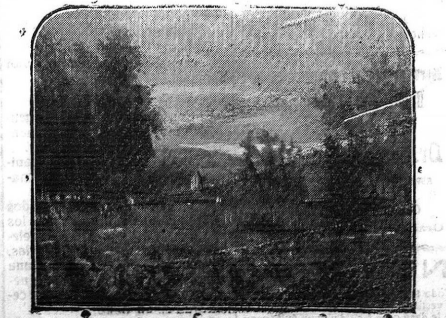
Madrid: Arte catalán moderno.—Paisaje, por Francisco Vayreda

La mayor producción de venta obtenida anunciando en EL DEFENSOR DE GRANADA