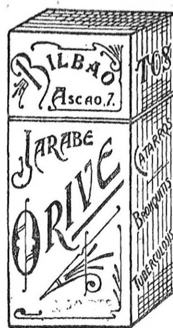
EL MEJOR remedio para EL PEOR catarro, Jarabe de Orive. Precio, 4'50 pesetas

Hay una avalancha de peticiones para concurrir al baile rojo del sábado, el cual tendrá su contera el domingo con una Piñata sorprendente y un sugestivo repertorio musical.