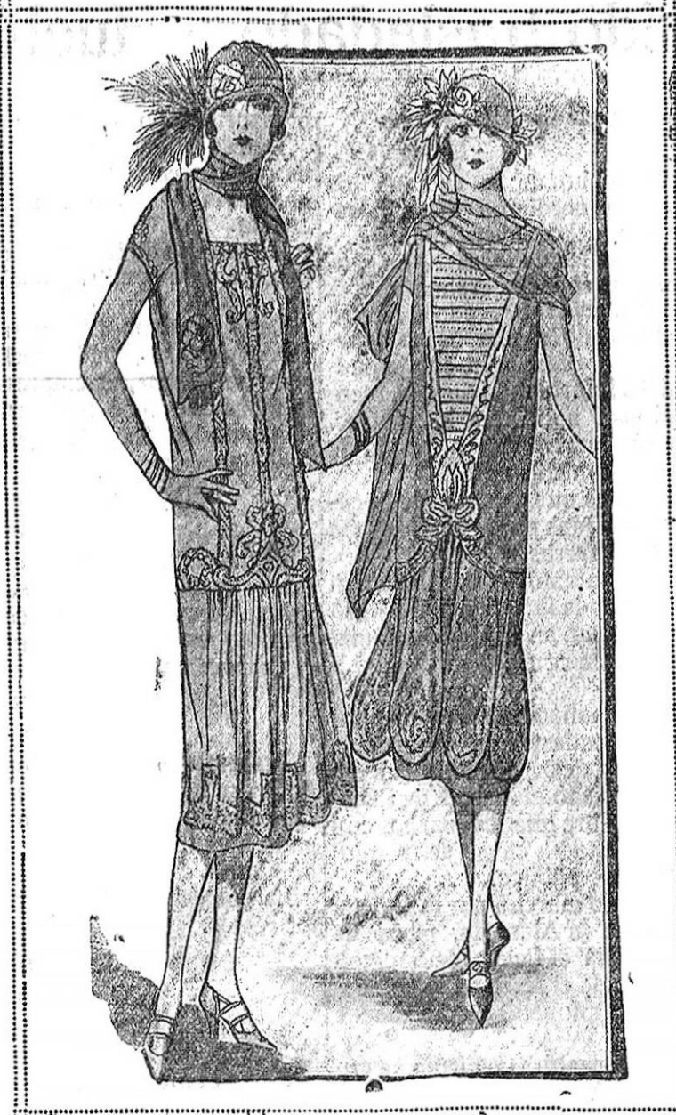
Traje de marroquín, color reseda, falda adornada en todo su alrededor con pequeños volantes de la misma tela, igual que arriba del escote y en las mangas. Cinturón de piel plateada. El segundo de estos trajes es de ceceo color Burdeos, llevando como adorno piel de gamo en su color natural. Pequeños botones de seda color Burdeos.