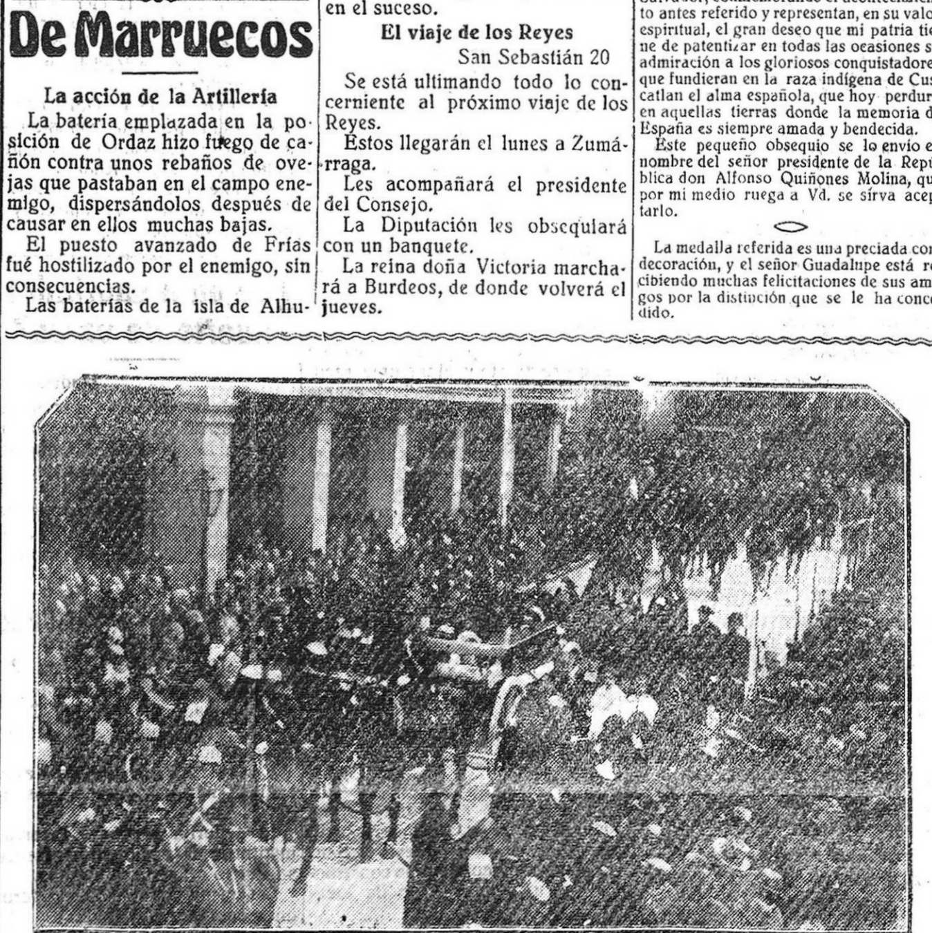
BURGOS.—El entierro del Cardenal Benlloch pasando por la plaza de Santa Cruz.

La medalla referida es una preciosa condecoración, y el señor Guadalupe está recibiendo muchas felicitaciones de sus amigos por la distinción que se le ha concedido.