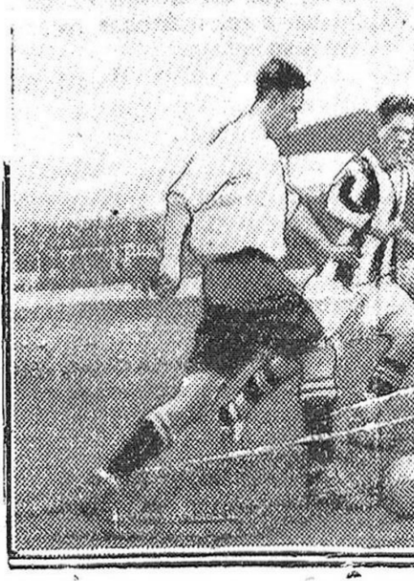
MADRID.—Del comentado partido de Fútbol entre el Gimnástica y el Real Madrid; una jugada interesante.

Se levanta la sesión a las doce de la mañana.