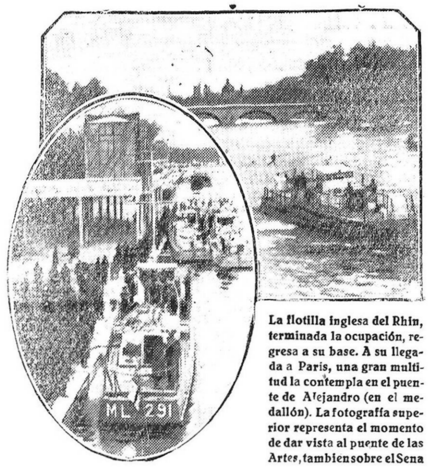
La flotilla inglesa del Rin, terminada la ocupación, regresa a su base. A su llegada a París, una gran multitud la contempla en el puente de Alejandro (en el medallón). La fotografía superior representa el momento de dar vista al puente de las Artes, también sobre el Sena