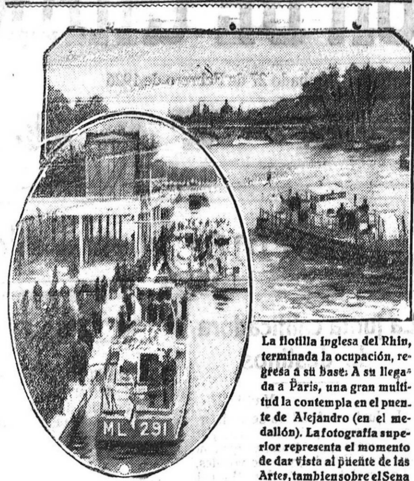
La flotilla inglesa del Rhin, terminada la ocupación, regresó a su base. A su llegada a París, una gran multitud la contempla en el puente de Alejandro (el medallón). La fotografía superior representa el momento de dar vista al puente de las Artes, también sobre el Sena