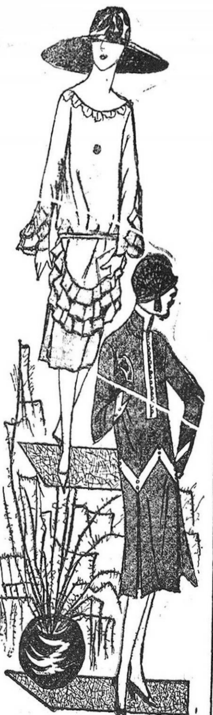
Trajes de gasa Georgette de suaves tonos pastel, que tanto están en boga, adornados con bellos bordados de hilos metálicos de tonos que armonicen con el color del traje. Se recomienda mucho que no haya en los adornos el contraste que tan en boga ha estado hasta ahora y que al presente es todo lo contrario.