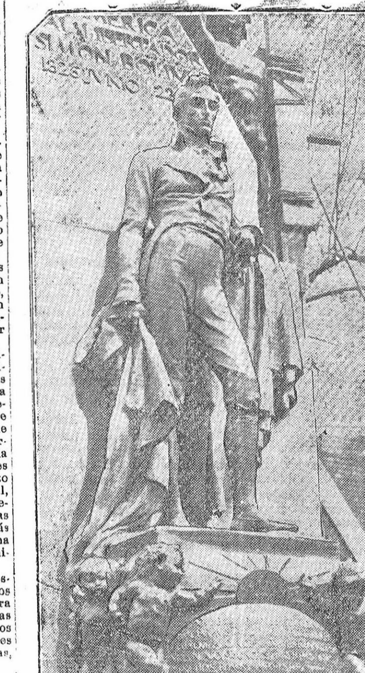
El monumento a Bolívar, esculpido por Benlliure. He aquí la figura principal de esta nueva obra de arte que se exhibe en el estudio del maestro...