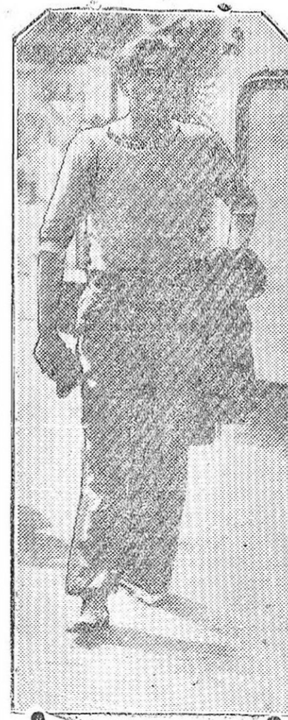
Uno de los supervivientes del hidro de la base naval de Barcelona, que cayó al mar en el puerto de Palos, recogido a bordo del crucero «Cataluña».

«Señor alcalde, Granada. Accedo muy complacido su pedido tripulación crucero Buenos Aires» recibirá instrucciones para esa hermosa ciudad de históricas adiciones y poder así tributar merecido homenaje memoria Reyes ilustres auspiciaron empresa descubrimiento América.—Alvear, presidente de la Nación.