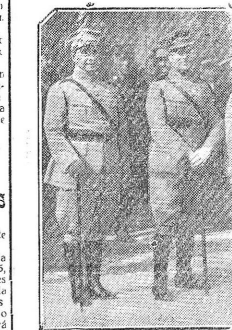
Los cuatro oficiales lusitanos que con motivo del encuentro de fútbol Lisboa-Madrid (selecciones militares), han llegado a la corte, al salir de la estación de las Delicias, recibidos por representaciones diplomáticas y militares.