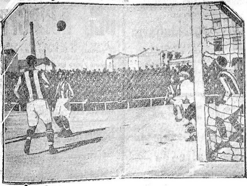
MADRID.-El partido de ayer Gimnástica-Racing. Una salida del portero de la Gimnástica