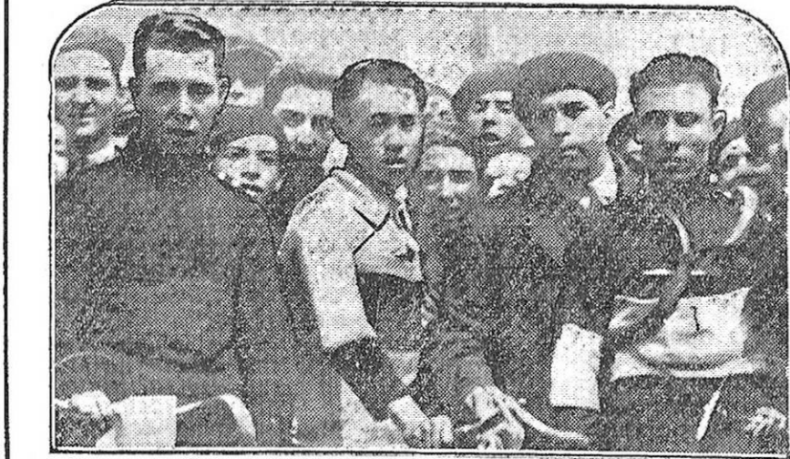
MADRID.-La carrera del «kilómetro lanzado». Los ganadores de la carrera ciclista.