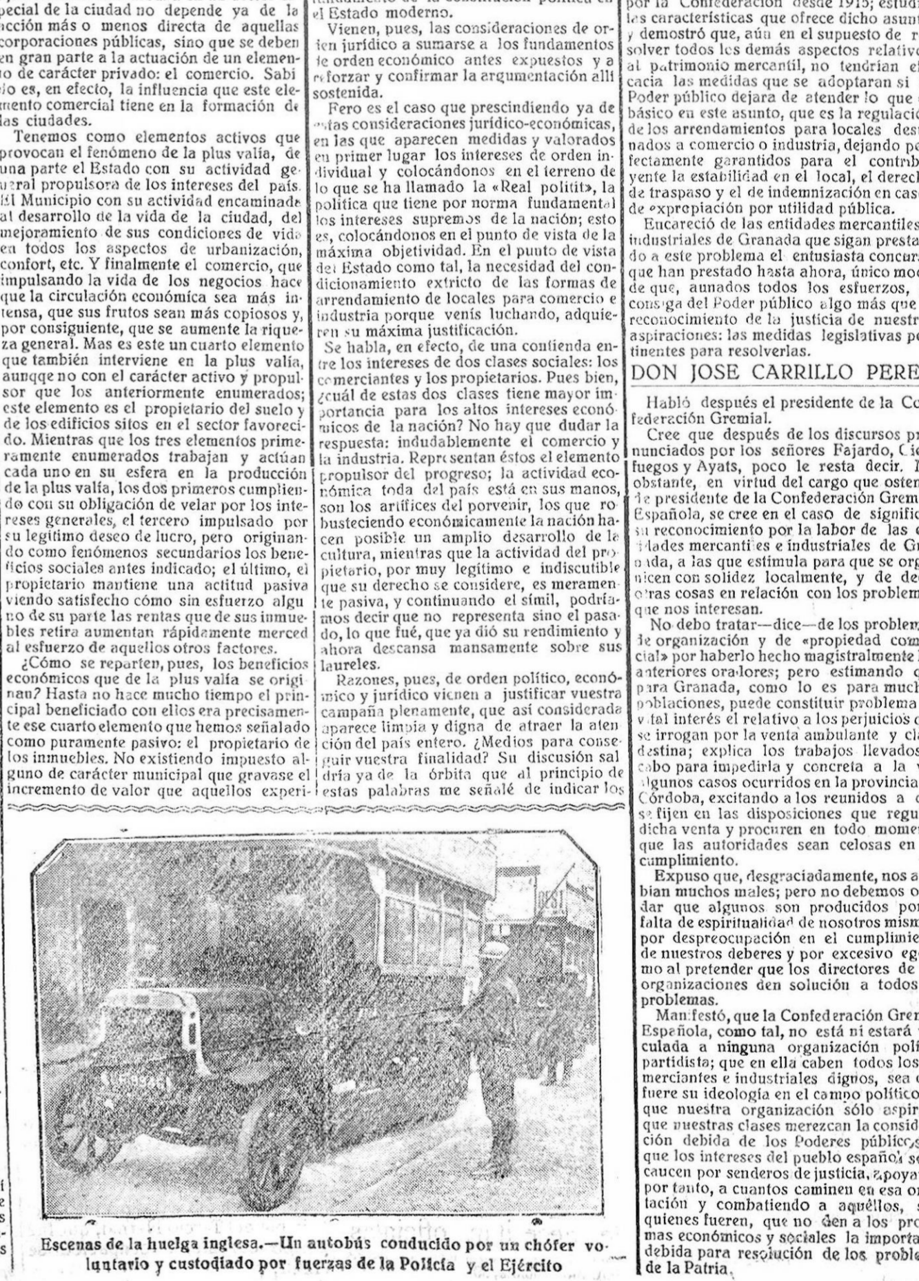
Escenas de la huelga inglesa.—Un autobús conducido por un chófer voluntario y custodiado por fuerzas de la Policía y el Ejército