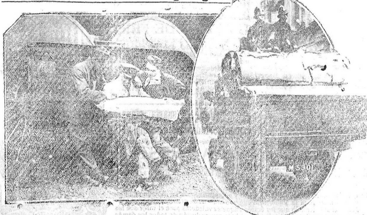
Un maquinista y unos fogoneros voluntarios estudiando el plano de la ruta a seguir antes de la salida del tren que conducen. En el óvalo, una camioneta cargada de bobinas de papel, custodiada por la Policía, para «La Gaceta de Inglaterra», el periódico que ha publicado el Gobierno durante la huelga de los hipógr fos.