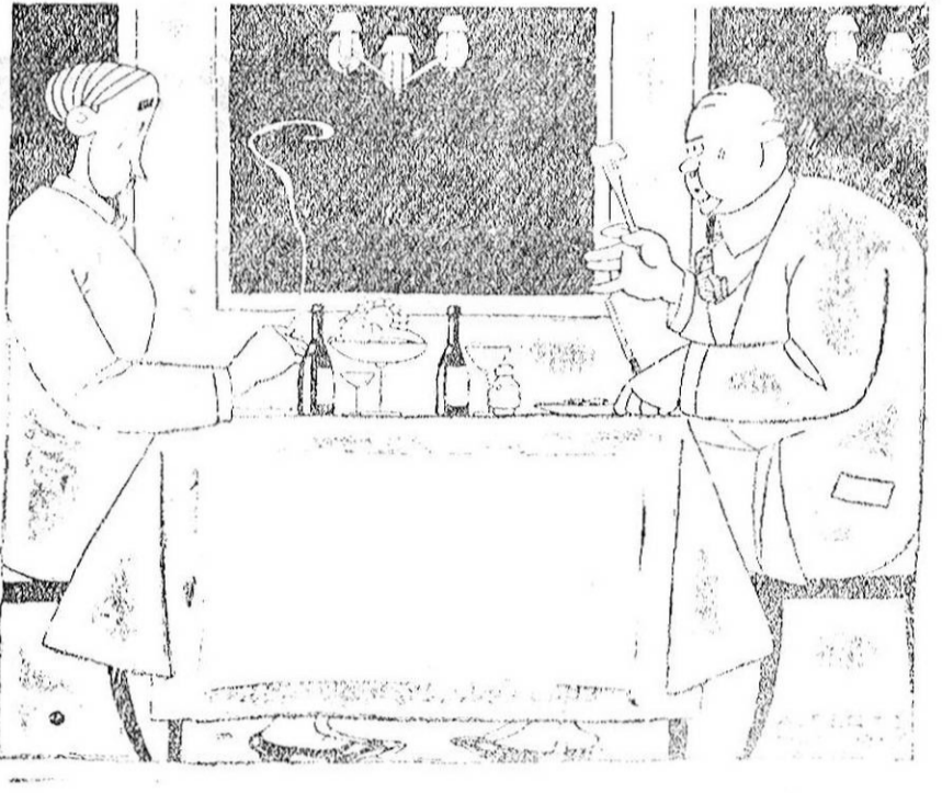
—Verdaderamente que es cosa idiota esto de mascar; pero no creo que alguien se valga de la boca de los demás para poder comer. — ¡, señor: los dentistas.