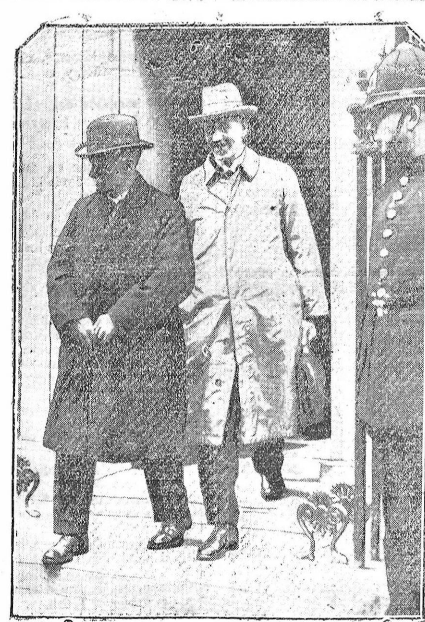
LONDRES.—Los líderes laboristas Mr. Pugh y Mr. Citrine, que tan directamente intervinieron en la terminación de la última huelga