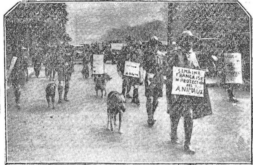
LA PROTECCION A LOS ANIMALES EN FRANCIA.—Para luchar eficazmente contra la vivisección, la Liga protectora ha hecho que los perros sanitarios dieran un paseo por París, y así se ha conseguido un éxito enorme de propaganda.