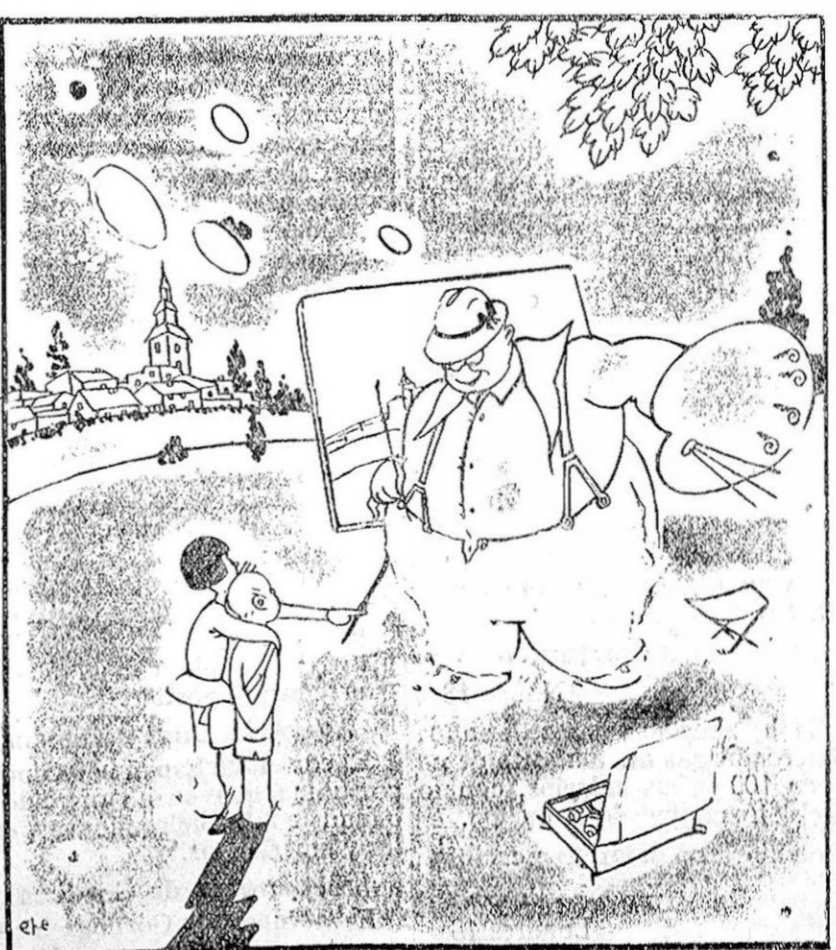
EL PINTOR.—¿Qué, «chavales», os gusta la pintura? LOS CHICOS.—Sí, pero no es a eso a lo que venimos. Esperamos a que usted se sienta pa ver qué pasa.