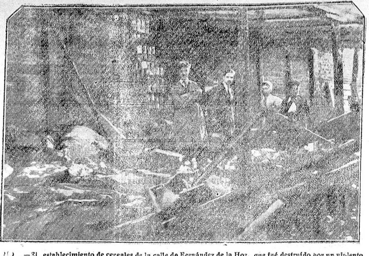
El establecimiento de cereales de la calle de Fernández de la Hoz, que fué destruído por un violento incendio.

después otra, un poco delantera, y un descabello a la primera. Ovación delirante y la oreja.