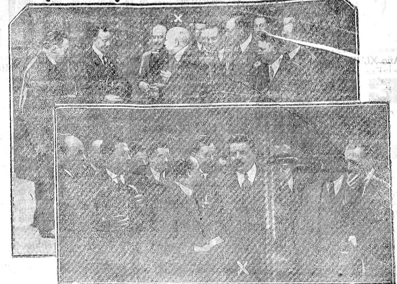
Señores Potcaré y Herriot al salir del Elíseo después de ser consultados durante la crisis francesa por el presidente de la República, M. Doumergue.

Se aplazaron las sesiones hasta nueva convocatoria.