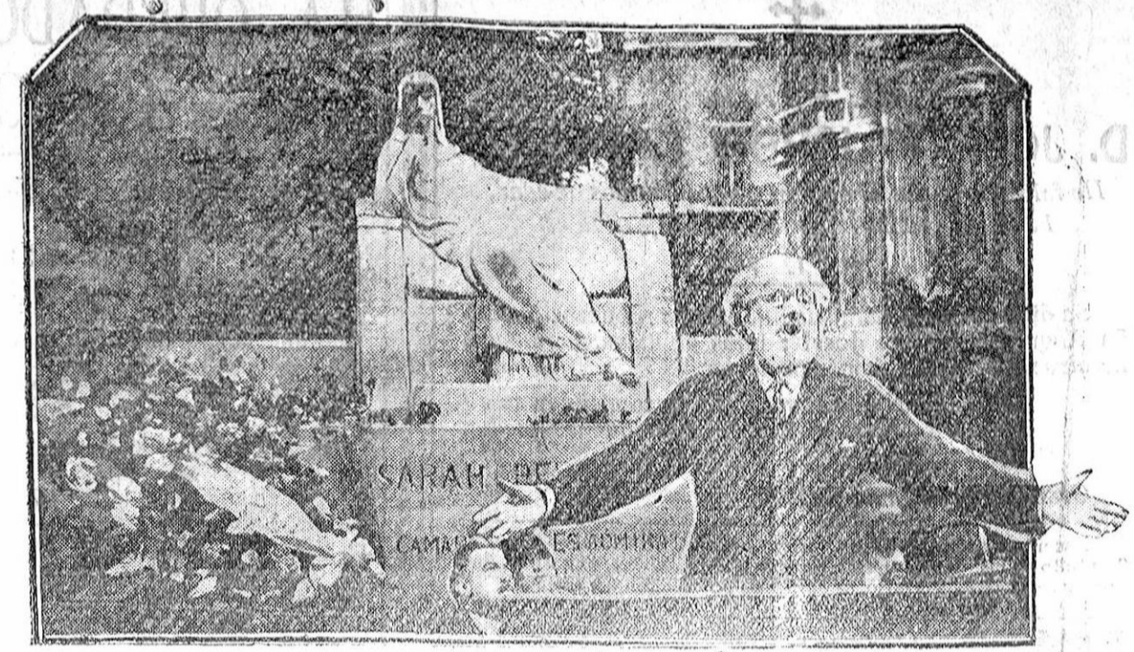
INAUGURACION DEL MONUMENTO A LA GRAN ACTRIZ TRAGICA SARAH BERNHARDT EN PARIS.—En el ángulo, el poeta Richépin pronunciando el discurso inaugural.

Esta tarde, a las cinco, en Lanjarón, será obsequiado con un the el general don Leopoldo Saro.