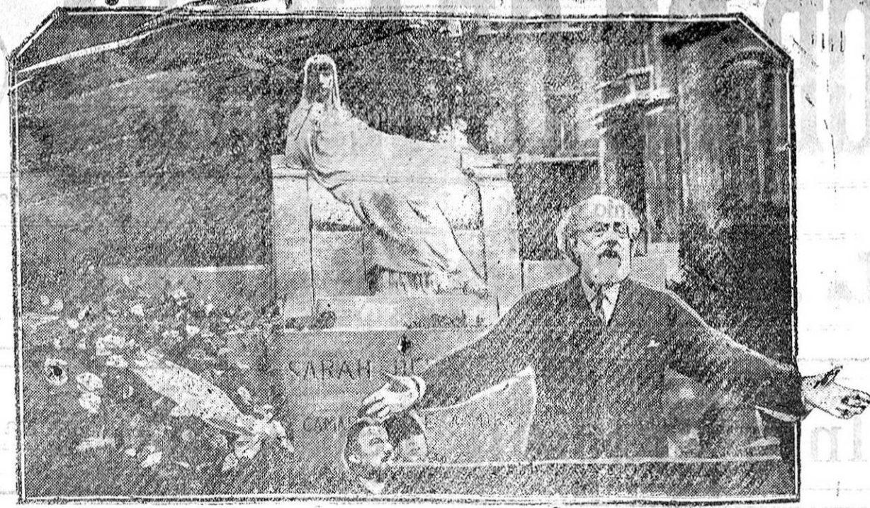
INAUGURACION DEL MONUMENTO A LA GRAN ACTRIZ TRAGICA SARAH BERNARDT EN PARIS.—En el ángulo, el poeta Richepin pronunciando el discurso inaugural.

Esta tarde, a las cinco, en Lanjarán, será obsequiado con un the el general don Leopoldo Saro.