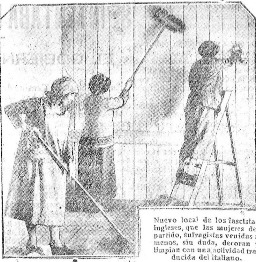
Nuevo local de los fascistas ingleses, que las mujeres del partido, sufragistas venidas a menos, sin duda, decoran y limpian con una actividad traducida del italiano.

Todos los oficios festejan a su Patrono. ¿Por qué los chóffers no han de hacer lo mismo con el suyo? Ya tenemos el templo de San Cristóbal casi terminado, y es mi deseo que en un día determinado se reúnan todos los que gustan automóvil, para honrar al Patrono, unirse en aquel sitio, cantar para pasar un día honesto y santamente divertidos, y respirar a pleno pulmón, sin peligros ni corridas por caminos o carreteras. Los chóffers saben muy bien que San Cristóbal es su Patrono y que es necesario dar el Sauto el honor y culto que merece, para que en todo tiempo sea él con ellos y viajen y gulen con absoluta seguridad. Han venido a mí algunos chóffers, y me dicen estas o parecidas palabras: «Mire usted, nosotros queremos a nuestro Patrono como el que más, y si a la voluntad y amor que le tenemos, tuviéramos