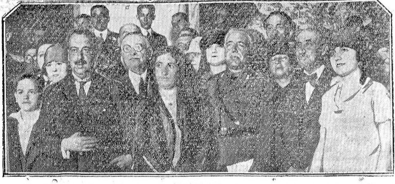
MADRID.—Recepción en el Ayuntamiento en honor de los congresistas del Motor y del Automóvil.

La Revista de Modas mas útil, elegante y de mayor circulación es La Moda Práctica