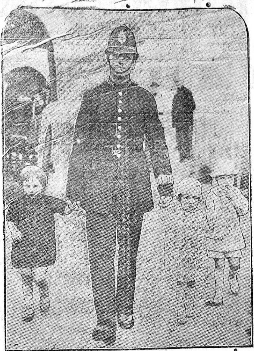
Un guardia inglés conduciendo a tres encantadores pequeñuelos que habían cometido la travesura de perderse en las calles de Londres. Es de creer que el guardia, no obstante ir tan bellamente acompañado, fuese acordándose de algún parente próximo de las criaturas.

Volviendo a los aspectos que el problema ofrece en Granada, creemos que ya ha llegado la hora de pensar seriamente en estas cosas y de actuar con sentido práctico. El hecho de poner un anuncio de Granada en un número extraordinario del «Times» ya es algo, pero no es todo.