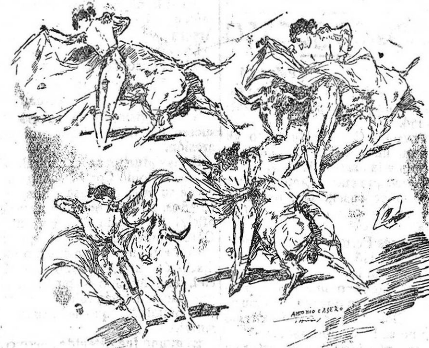
Varios momentos de un magnífico quite de Chicuelo, en una de las últimas corridas celebradas en la plaza de Madrid.