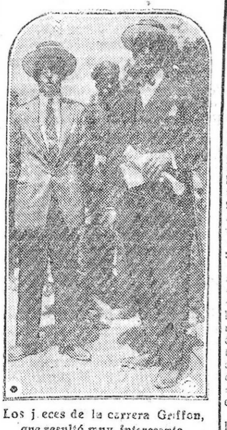
Los jeces de la carrera Griffon, que resultó muy interesante.