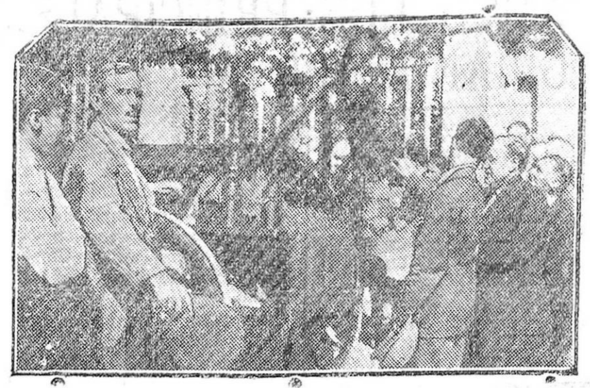
MADRID.—El entierro del socialista Vicente Barrio. Momento de llegar al féretro al cementerio civil.