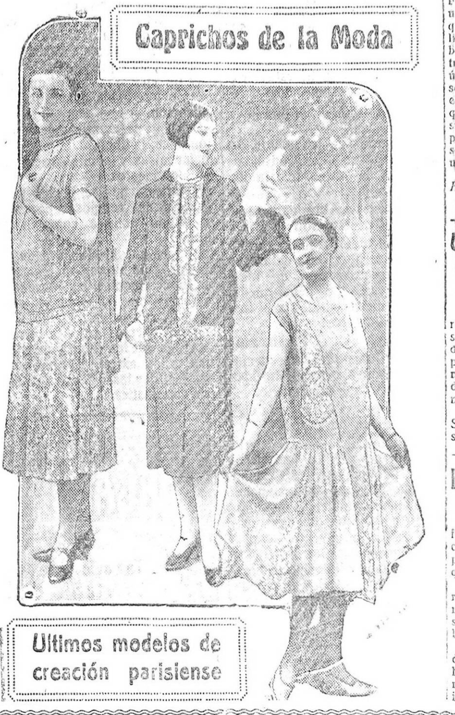
Caprichos de la Moda