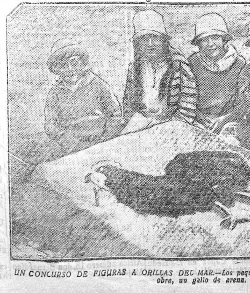
UN CONCURSO DE FIGURAS A ORILLAS DEL MAR.—Los pequeños artistas contemplan satisfechos su obra, un gallo de arena.