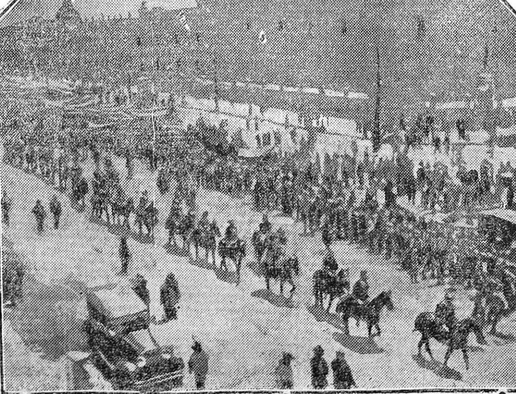
Una de las primeras fotografías del conflicto llegadas a Europa.

Los obreros mejicanos recorren en manifestación las calles de la capital de Méjico, en prueba de adhesión a la política anticlerical de Calles