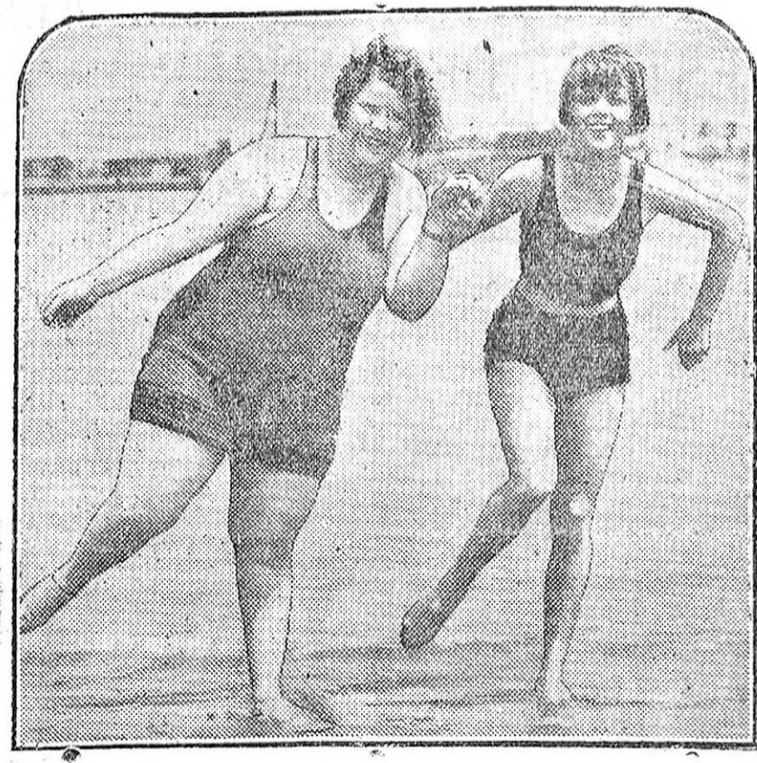
EN UNA PLAYA EXTRANJERA.—Aunque no lo creáis, es cierto que la señorita «ligermente» obesa ha vencido, en un concurso de natación, a la amiga que se muestra a su lado. No penséis por esto que se trata de un fiburón. Es que la obesidad tiene también sus privilegios, y uno puede ser el de resultar ágil en el agua, quizá por la relación que guarda con los grandes buques.