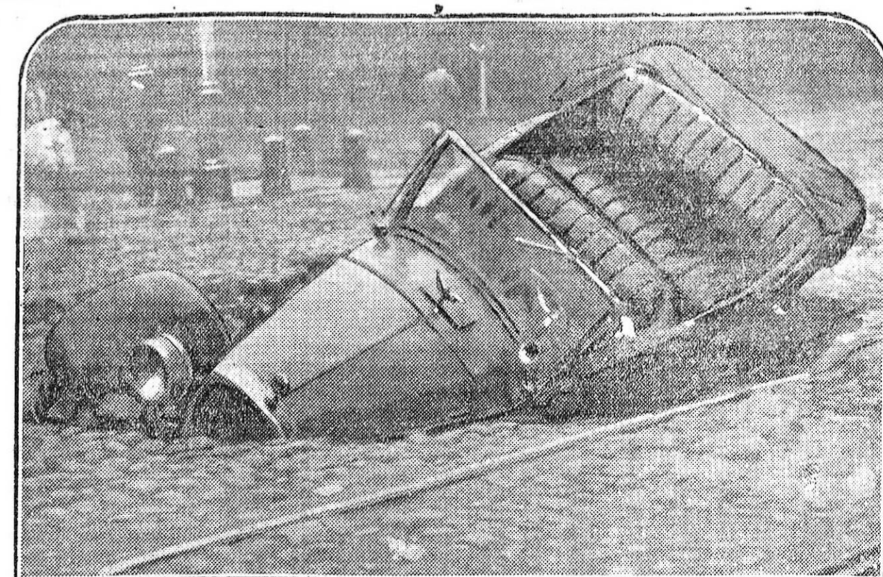
MADRID.—Un hundimiento en la plaza de España.—Cae un automóvil en una zanja.—Estado en que quedó el automóvil al hundirse un trozo de pavimento.

Toda persona que se suscriba a «El Defensor de Granada» recibirá éste gratuitamente hasta fin de mes. Suscripción, 2 pesetas.