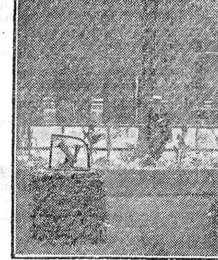
Lo es el del Palais Royal, de París, que se conformaba con tronar al mediodía bajo la acción del sol. Desde la guerra el cañoncito está mudo. Ahora volverá a sonar; pero su estampido no es cosa que pueda espantar a nadie.