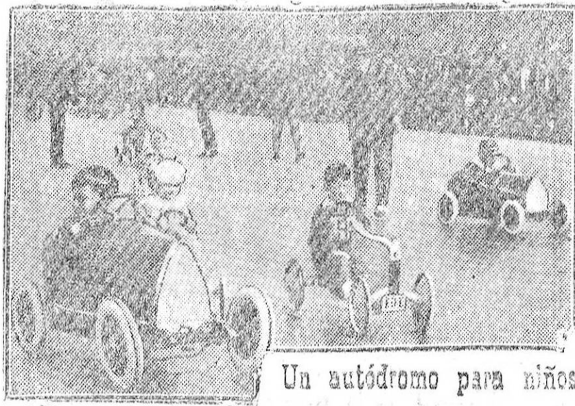
Un autódromo para niños