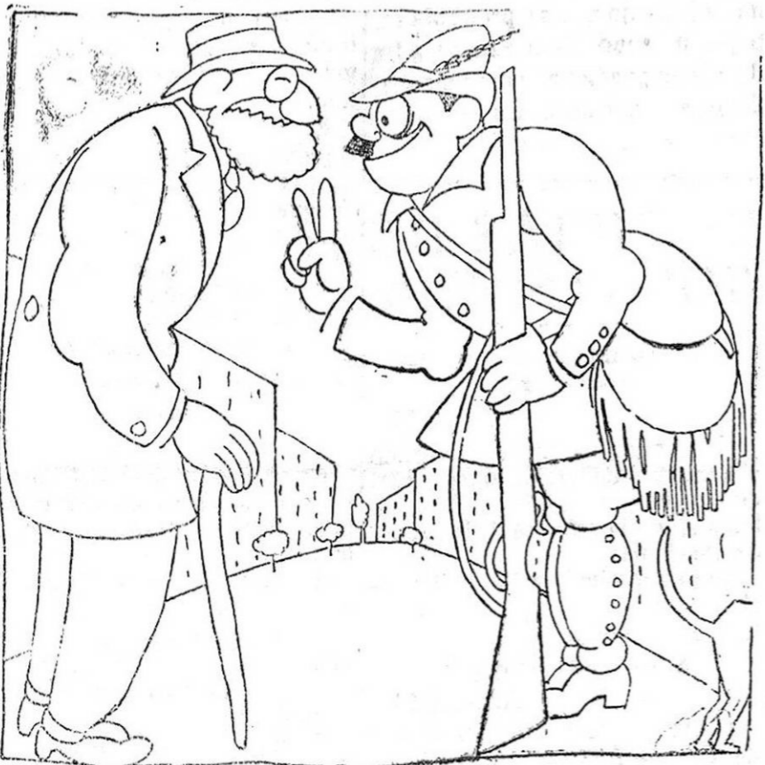
—Doctor, he ganado dos kilos desde el accidente de caza... —El médico.—Es natural, hombre; tenga presente que recibió tres perdigonadas.