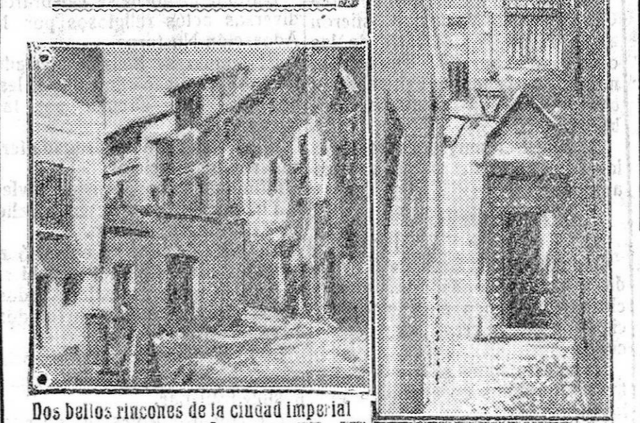
Los bellos rincones de la ciudad imperial

Toledo, la ciudad artística y monumental, ha sido estos días hermoso escenario del Congreso Eucarístico. Al mismo tiempo, Toledo celebra el centenario de su Catedral. La Catedral de Toledo, milagro del arte, verdadero poema de piedra, fué levantada en el mil novecientos y cinco, templo donde oraban los cristianos anteriores al cautiverio sarraceno, y que sirvió de mezquita durante la dominación musulmana. De nuevo pasó a los cristianos en el año 1085, época en que fué deruido por el Rey Ferrnando III el Santo, que en unión del Arzobispo Jiménez de Rada, colocó la primera piedra del actual edificio en 1227, y cuyas obras quedaron terminadas en 1425. Fulguró en la ejecución de tan soberbio trabajo el genio arquitectónico de Pedro Pérez, maestro del gótico primitivo, Rodrigo Alonso, Alvar Gómez y los hermanos Arregui Egas. La factura ir reprochable de la Basílica, tipo de las catedrales de Bourges, Friburgo y Amiens, construida en la altura media de la imperial ciudad, consta de cinco naves, con doble girol, y la maestra con elegante colocación de los muros, respondiendo a la más perfecta unión del sentimiento artístico y mecánico, por cuyos altísimos cuerpos penetra la luz irizada y policroma que le prestan bien distribuidos, 250 ventanales. La limpieza de los perfiles, las capillas de bóvedas capuliformes, sin arbolantes, la prolongada y admirable entimía de sus framos... todo ello produce en el ánimo del visitante el escalofrio sublime de lo grandioso.