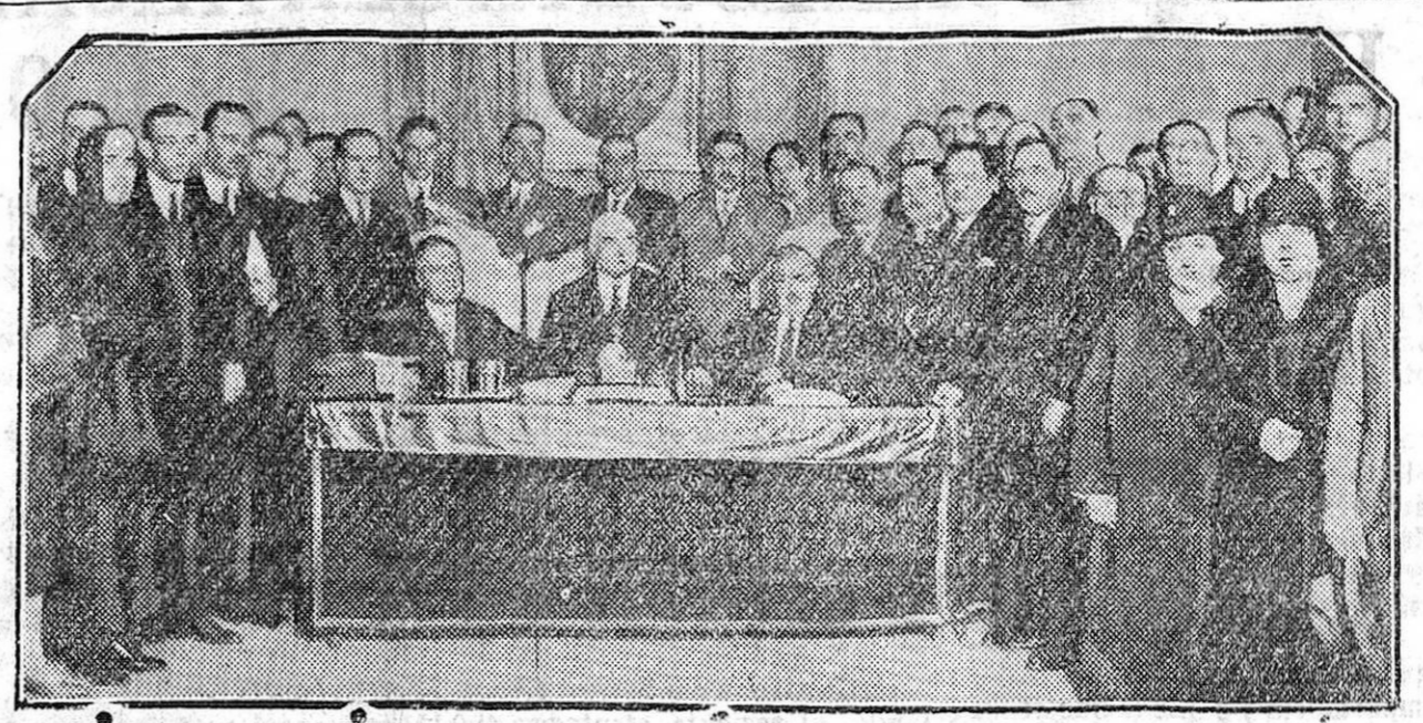
MADRID.—La Mesa presidencial y algunos de los congresistas asistentes a la primera sesión de la Asamblea de la Confederación nacional de maestros.

En algunos kioscos se ha subido estos días—ignoramos por qué—el precio del pan, expendiéndose el kilo a sesenta y cinco céntimos, o sea cinco céntimos más caro del fijado en la relación publicada últimamente por la Junta de Abastos.