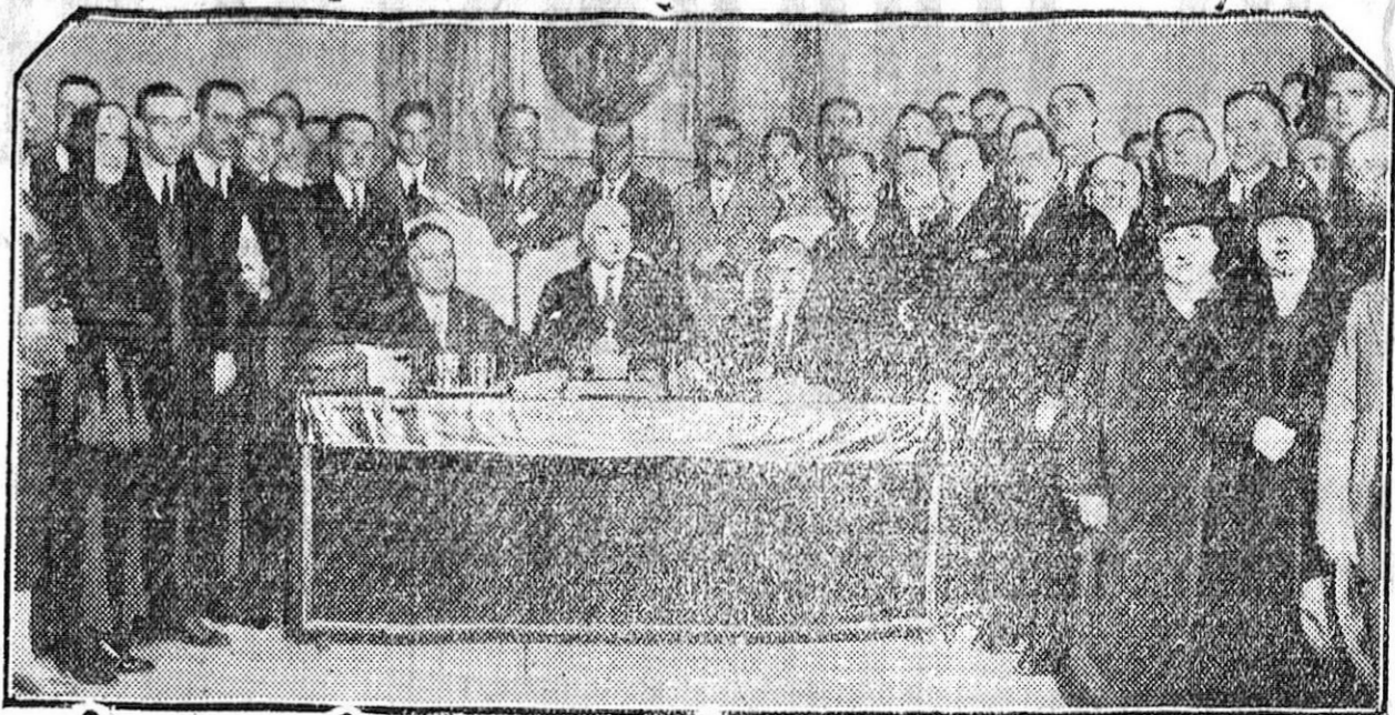
MADRID.—La Mesa presidencial y algunos de los congresistas asistentes a la primera sesión de la Asamblea de la Confederación nacional de maestros.

Los guardias de Seguridad, de servicio en Plaza Nueva, dieron cuenta en la Comisaría, de que en el cuarto piso de la calle de Hermosa número 1 se había producido un conato de incendio al quemarse una cortina de uno de los balcones.