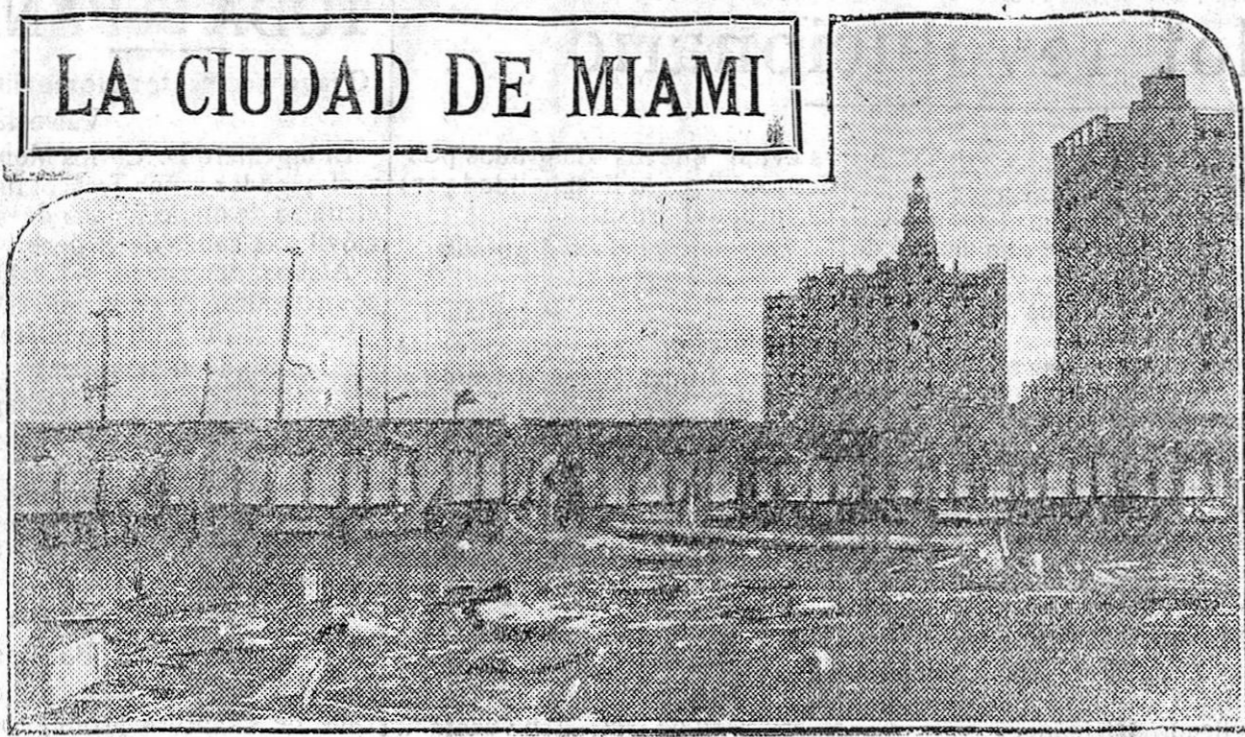
Los trabajos de descombro de la ciudad de Miami, destruida por el último ciclón de La Florida.