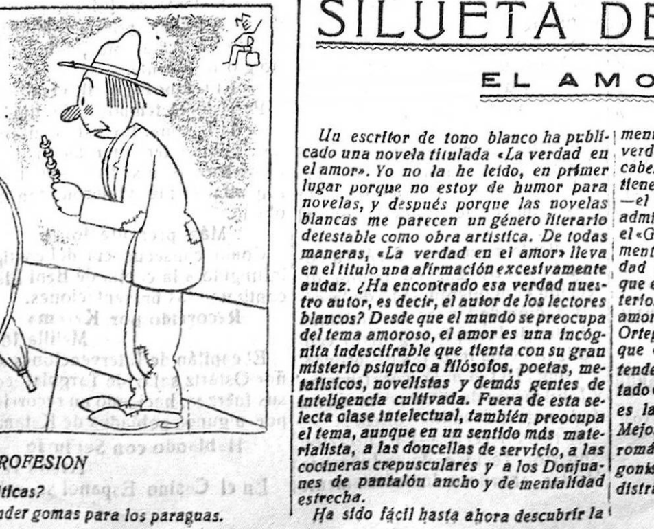
CAMBIO DE PROFESION —¿Usted no hacia antes caricaturas políticas? —¿Sí, señor; pero ahora me dedico a vender gomas para los paraguas.

Un escritor de tono blanco ha publicado una novela titulada «La verdad en el amor. Yo no la he leído, en primer lugar porque no estoy de humor para novelas, y después porque las novelas blancas me parecen un género literario detestable como obra artística. De todas maneras, «La verdad en el amor» lleva en el título una afirmación excesivamente audaz. ¿Ha encontrado esa verdad nuestro autor, es decir, el autor de los lectores blancos? Desde que el mundo se precupia del tema amoroso, el amor es una incógnita indescribible que tiene con su gran misterio psicológico a filósofos, poetas, metafísicos, novelistas y demás gentes de inteligencia cultivada. Fuera de esta selecta clase intelectual, también preocupa el tema, aunque en un sentido más materialista, a las doncellas de servicio, a las conteras crepusculares y a los Donjuanes de pantalón ancho y de mentalidad estrecha. Ha sido fácil hasta ahora descubrir la