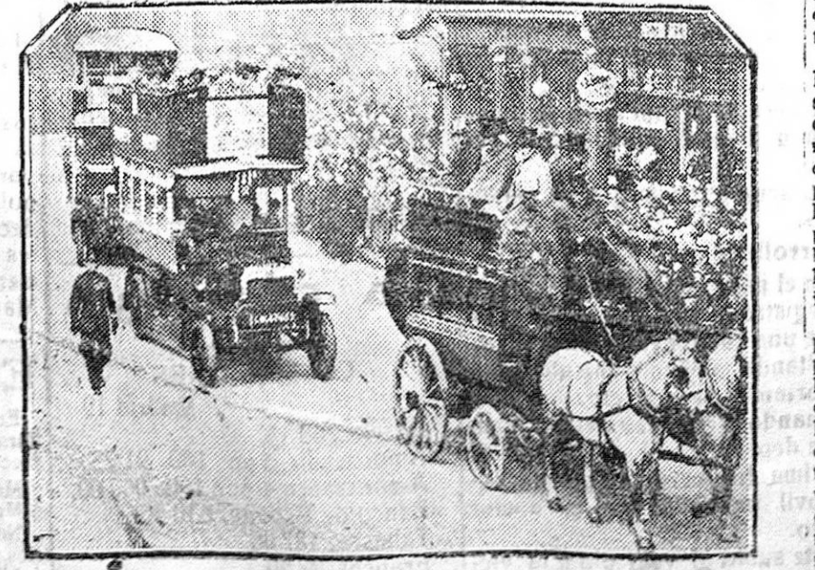
LA LOCOMOCION Y SUS PROGRESOS.—Curioso contraste entre el «separ» de nuestros abuelos y el autobús de hoy.

La comisión del festival que organizaban los chóferes a beneficio de las Escuelas de San Cristóbal pone en conocimiento del público que no puede celebrarse a causa del mal tiempo.