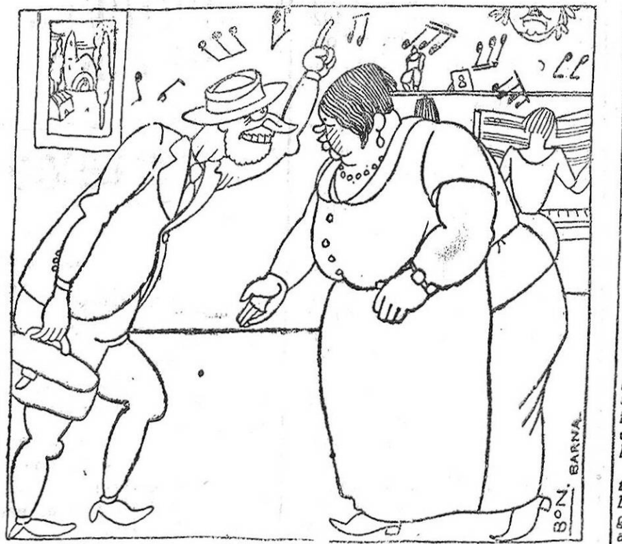
—¿Que es usted el afinador de pianos?... ¡Pero si mi hija no le ha llamado! —Ella... no, señora, ¡han sido los vecinos!..