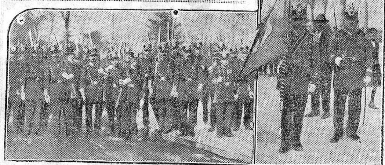
Desde el Ayuntamiento de Madrid, en que desde tiempo inmemorial se hallaban, han sido trasladadas al Parque de Artillería, donde con los honores debidos serán en adelante custodiadas, las banderas de la veterana Milicia Nacional, de tan gloriosa historia en los anales de la Libertad.

A la ceremonia asistieron representantes del Ayuntamiento y del Ejército y una banda militar. El desfile de los milicianos y sus enseñas fue presenciado por un público numerosísimo, que ovacionó al tradicional Cuerpo, tan popular y querido en Madrid.