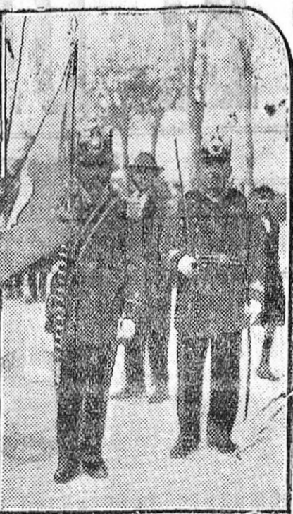
A la ceremonia asistieron representaciones del Ayuntamiento y del Ejército y una banda militar. El desfile de los milicianos y sus enseñas fué presenciado por un público numerosísimo, que ovacionó al tradicional Cuerpo, tan popular y querido en Madrid.