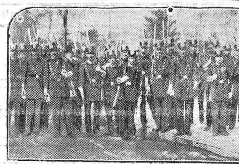
Desde el Ayuntamiento de Madrid, en que desde tiempo inmemorial se hallaban, han sido trasladadas al Parque de Artillería, donde con los honores debidos serán en adelante custodiadas, las banderas de la veterana Milicia nacional, de tan gloriosa historia en los anales de la Libertad.