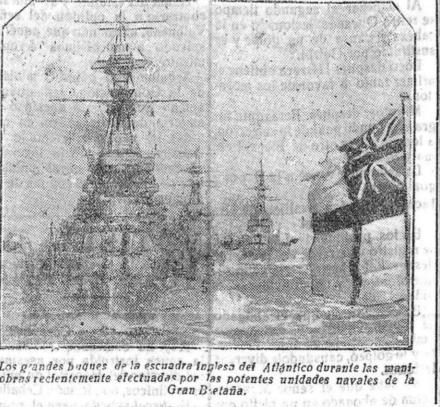
Los grandes buques de la escuadra Inglesa del Atlántico durante las maniobras recientemente efectuadas por las potentes unidades navales de la Gran Bretaña.

Esta facilitó ropas a los salvados para que se mudasen. Es muy elogiada la conducta de la Benemérita.