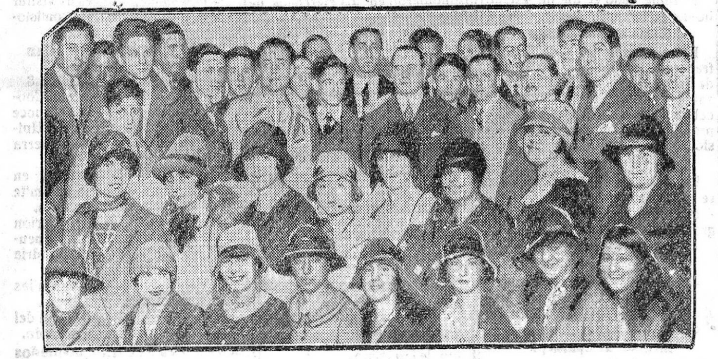
MADRID.—Las alumnas y alumnos de la Escuela de Pintura de San Fernando, que han inaugurado una Exposición de sus obras a beneficio de los damnificados por la catástrofe de Cuba.

Los Ferrocarriles vuelven a estar muy solicitados y pasan de 432,75 a 436 los Alicante y de 473,50 a 488 los Nortes.