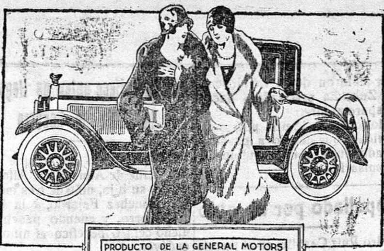
PRODUCTO DE LA GENERAL MOTORS

distinguido, Inglés, Francés, Contabilidad y Mecanografía, se ofrece para Secretaría Particular, Administración, Despacho, Oficina, etc.; excelentes referencias. Razón, Administración de este periódico.