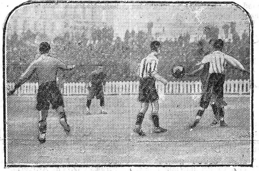
MADRID.—Una jugada del partido de fútbol del domingo.