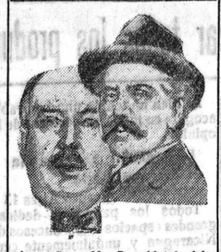
Los señores Mac Donald, jefe del laborismo inglés, y Cook, secretario de la Federación de mineros, que luchan por el mismo distrito electoral. Después de la actuación del señor Cook en la última huelga del carbón, los comunistas ingleses le presentan frente al ex primer ministro laborista.