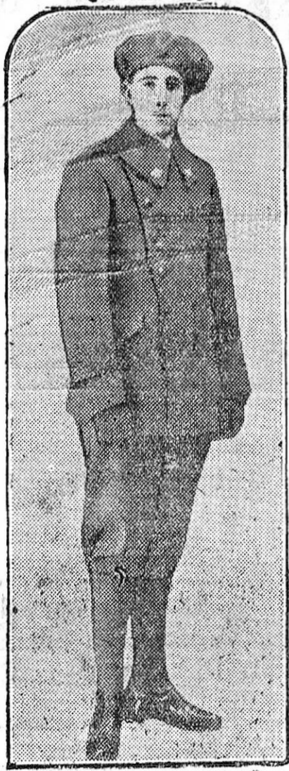
Los soldados han comenzado a lucir el uniforme único. Nuestra fotografía representa a un bizarro infante con el nuevo uniforme, en el que llama la atención, sobre todo, la novedad de la gallarda botina.