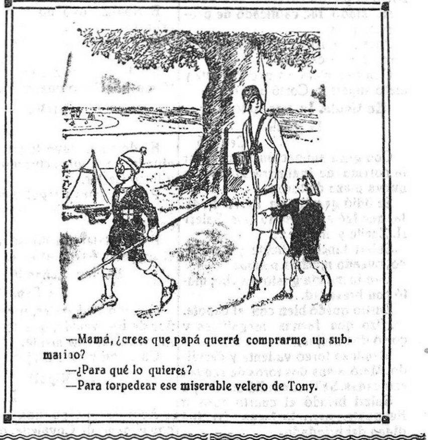
—Mamá, ¿crees que papá querrá comprarme un submarino? —¿Para qué lo quieres? —Para torpedear ese miserable velero de Tony.