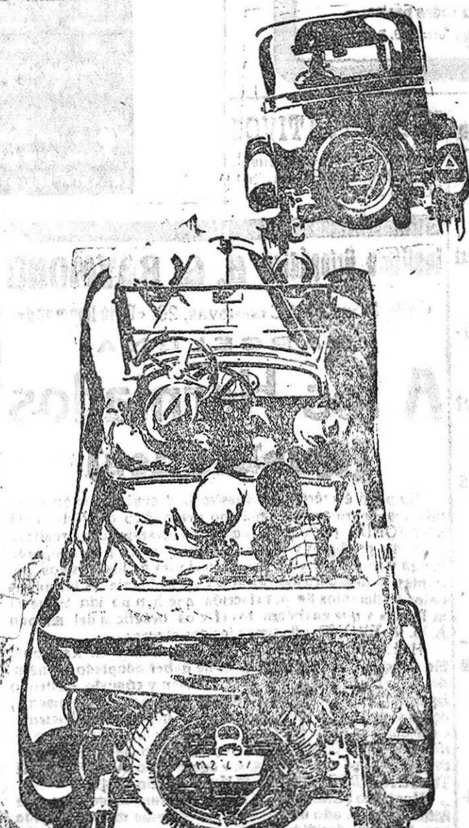
El Chevrolet lleva en sus carrocerías el sello de elegancia que caracteriza a Fisher