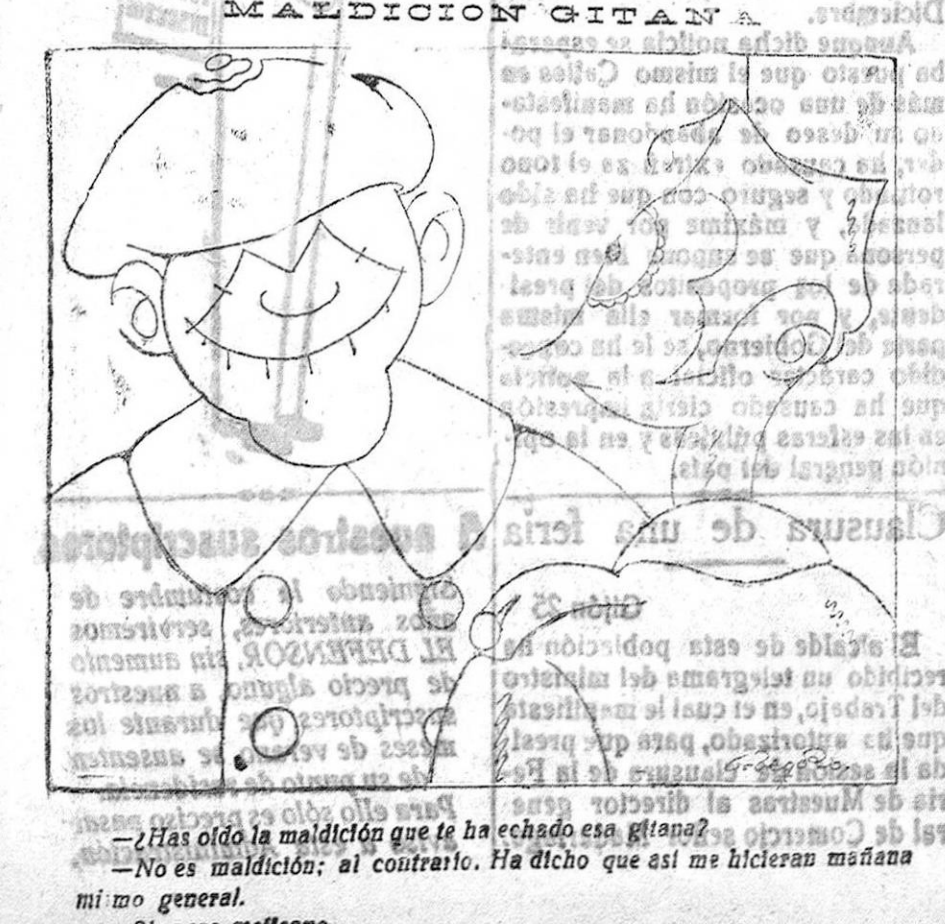
¿Has oído la maldición que te ha hecho esa gitana? —No es maldición; al contrario. Ha dicho que así me hicieron mañana mi mo general. —Si; pero meficcino.

Construcción y reparación de toda clase de maquinaria. - Piezas especiales para automóviles. - Motos para mosaicos. Bombas patentadas VALCARCE. Las mejores. Motores ELWE, para aceites pesados. Los de más garantías. - Motores eléctricos con cojinetes a bolas. Los de más duración. PRECIOS SIN COMPETENCIA F. ORTI, Ingeniero Gran Capitán, 18. Teléfono, 35. Granada