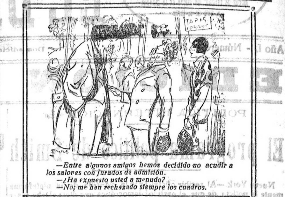
Entre algunos amigos hemos decidido no acudir a los salones con jurados de admisión. ¿Ha expuesto usted a menudo? No; me han rechazado siempre los cuadros.

Especialidad en la preparación para el ingreso en la Academia General Militar. La más antigua de las establecidas en Zaragoza. Más de 200 jefes y oficiales del Ejército preparados en esta Academia. Internado, gimnasio y clases en el mismo edificio. Soliciten reglamentos a la Dirección de la Academia. Argensola, 4, o Píza San Felipe, 3 (Colegio).—ZARAGOZA