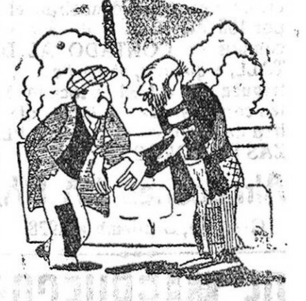
—Todos los días, bañistas que perecen; automovilistas que se matan... —Por algo yo no he subido nunca en auto ni me he bañado nunca...