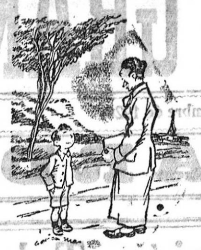
—¿Cómo es eso?... Tu madre no está en casa? Si yo le dije que iban a ir. —Por eso se ha marchado...

Después de haber presenciado la corrida de toros, el presidente se dirigió a su domicilio para comer.